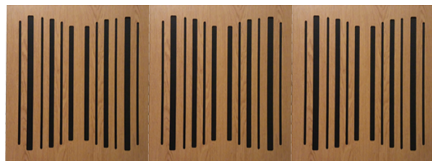
POLYFON - WS με όψη απομίμησης ξύλου από μελαμίνη Οριζόντια Τοποθέτηση

Συνολικό Πάχος: 33 & 53 mm Διαστάσεις: 595 x 595 mm