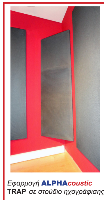
Εφαρμογή ALPHAcoustic TRAP σε στούντιο ηχογράφησης

Οι μπασοπαγίδες ALPHAcoustic είναι συσκευασμένες σε ειδική χαρτόκουτα για εύκολη και ασφαλή μεταφορά. Όλες οι συσκευασίες περιέχουν οδηγίες εγκατάστασης για εύκολη και γρήγορη τοποθέτηση. Για ευκολότερη ανάρτηση των μπασοπαγίδων από τους τοίχους (όποτε είναι απαραίτητο) είναι εφοδιασμένες με 2 σπές για ευκολότερη ανάρτηση με αυτοεκτονούμενες βίδες.